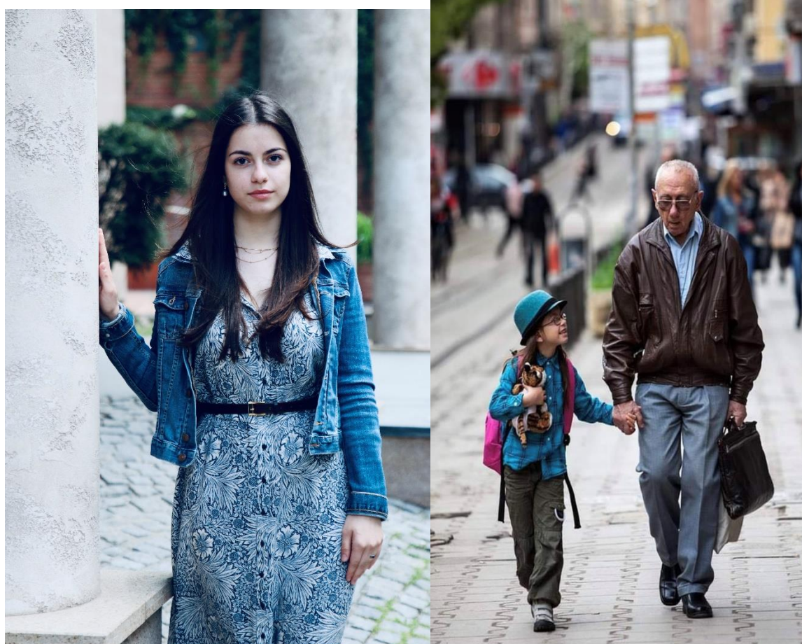
Снимката е отличена през 2014 г.

За жалост е един от предметите, които вече нямам в училищната си програма, но това е философията. В часовете ни по философия с госпожа Филипова имах възможността да опозная съучениците ми в различен, по-небитов план и това е много вдъхновяващо. Да можеш да разбереш за истината, за света не по точките от учебника, ами от гледните точки на хората, с които споделяш една класна стая. Дискусиите, които правихме в часовете винаги ми бяха безкрайно интересни, часовете бяха различни, смислени.