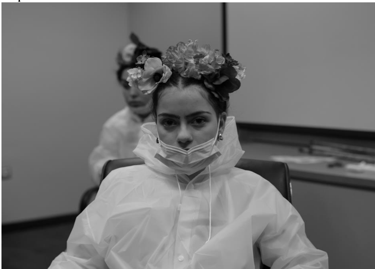
Снимката е от театралния фестивал в Малта – 2025 г. (Фрида Кало)

Иска ми се да се занимавам с изкуство, с театър, с неща, които ми носят смисъл в ежедневието. Не съм си избрала конкретна специалност все още, но интересите ми са насочени към режисурата, кулинарията, актьорското майсторство. Голям интерес за мен представлява и човекът така че ще добавя и психологията.