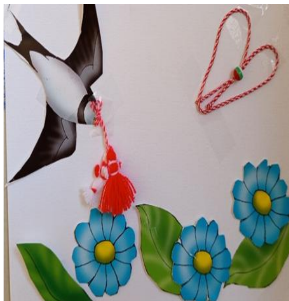
Добре дошла, Пролет!